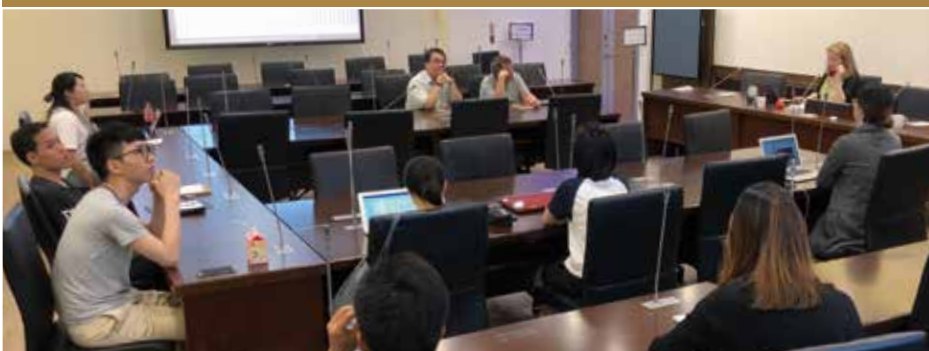
A New Deal for China's Workers ?