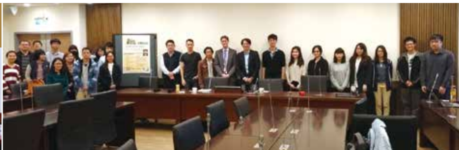
The European Investigation Order from a German Perspective