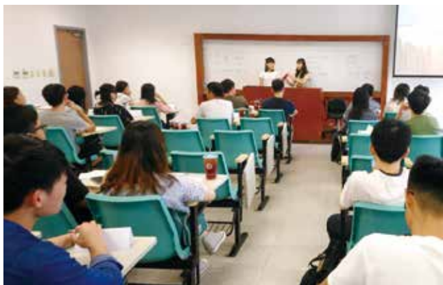
進行自我介紹的活動

畢業門檻介紹，讓大家提前知悉畢業門檻的細節事項。學長姐修課經驗分享，也讓研一新生對於研究生的「報告海」有了初步的藍圖，同時也為即將到來的研生活雀躍不已，能夠透過自己的搜尋，尋找資料，寫出屬於自己的報告。學長姐也分享自身如何找指導教授的經驗，讓學弟妹們對於此部分有初步的了解。學長姐也介紹相關工讀機會、老師助理之工作等，提供大家參