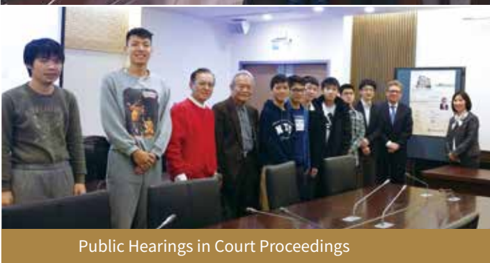
Public Hearings in Court Proceedings