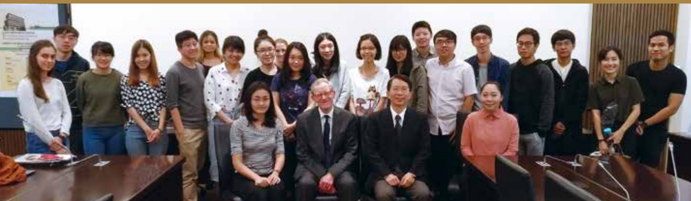
The Challenges facing national and transnational contract law