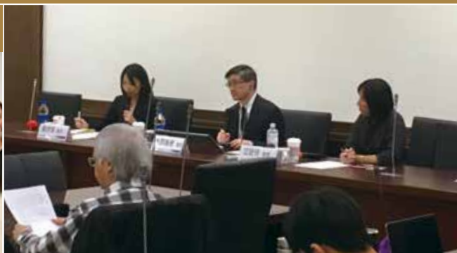
家事債務之強制執行 - 以交付子女會面交往為中心