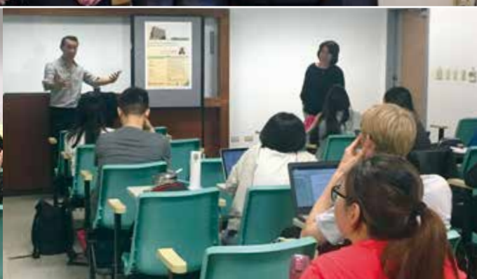
Torture, Forensic Investigation and Strategic Litigation in the Modern Era