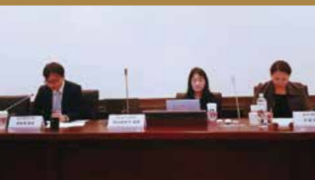
擴大使用刑事手段干預私領域之日本法趨勢