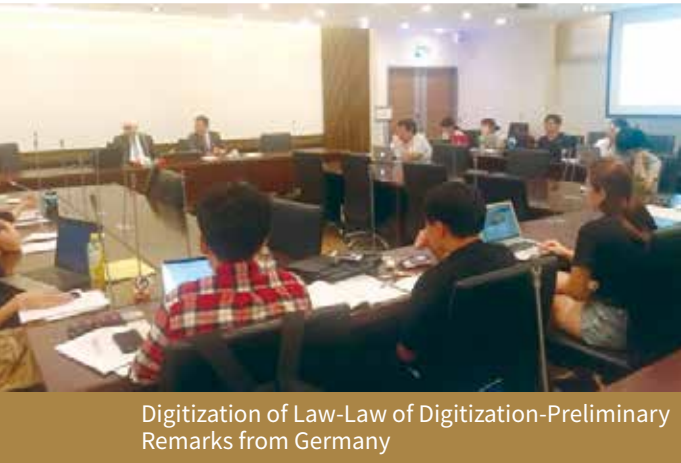
Digitization of Law-Law of Digitization-Preliminary Remarks from Germany