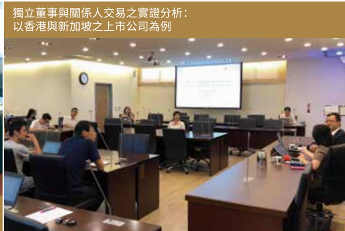
獨立董事與關係人交易之實證分析：以香港與新加坡之上市公司為例