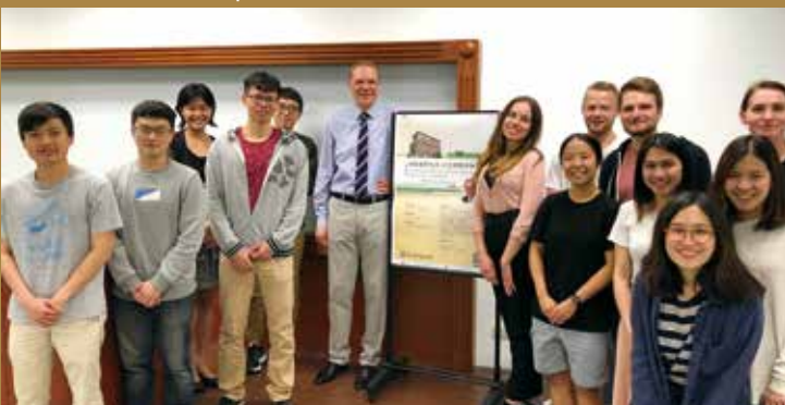
Private Law in the EU and the Idea of Regulatory Competition