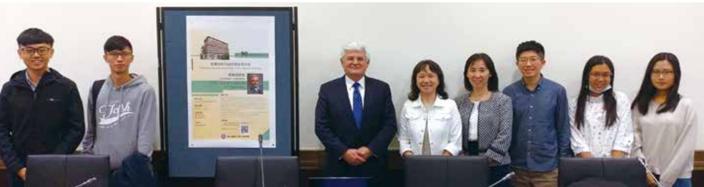
Customary Law and Judicial Power: From Today to Tomorrow