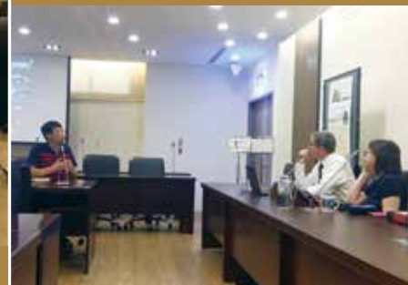
Legal System as Norm Packaging Platform