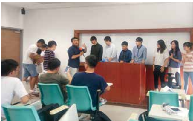
歡樂地進行團康遊戲