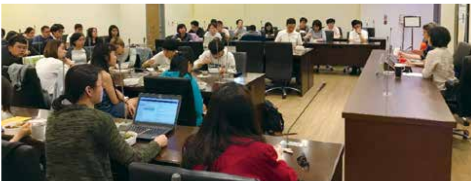
Lunch Talk 座談