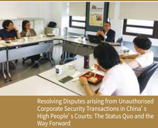
Resolving Disputes arising from Unauthorised Corporate Security Transactions in China's High People's Courts: The Status Quo and the Way Forward