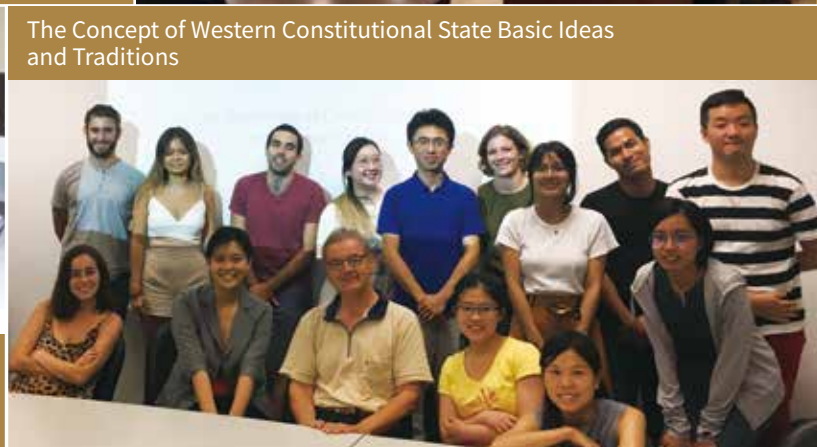
The Concept of Western Constitutional State Basic Ideas and Traditions