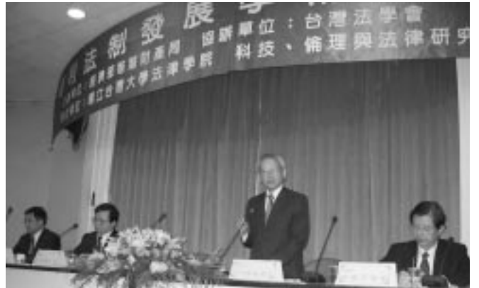
■ 專利法制發展學術研討會

科技、倫理與法律研究中心，原名「生物醫學法律研究室」，隨著生物科技日益千里，尤其複製羊「桃麗（Dolly）」在英國實驗成功的消息發表之後，使國內民眾開始注意到生物科技的發展與重要性。然而，其所引發的倫理、社會、法律問題，亟需進一步的研究討論，才能夠成為將來的政策與制度奠定合理共識的基礎。