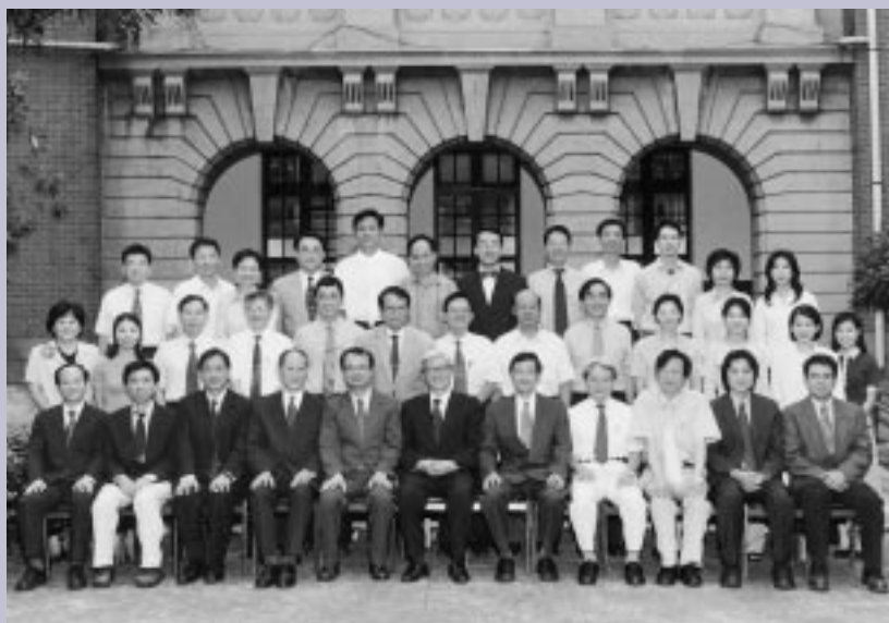
法律學院全體教職員合影（2003年9月）