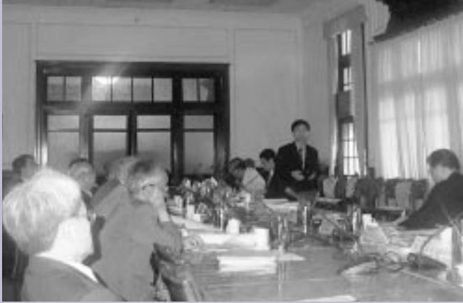
■羅院長向評鑑委員簡報評鑑資料。