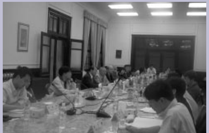
■評鑑委員與學生座談。