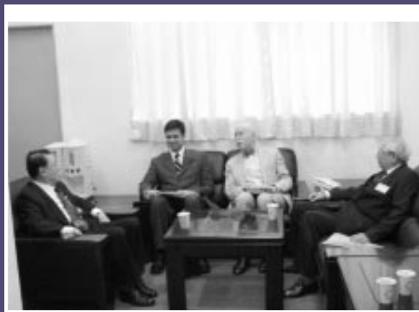
■開幕前交換意見，左起林永謀大法官、美國在台協會丁安德主任、孔傑榮教授、翁岳生院長。