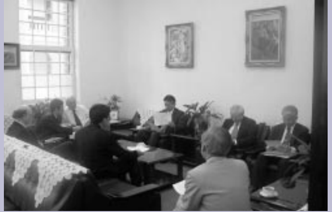
■評鑑委員參訪前交換意見。

4. 委員交換意見及綜合優缺點後完成訪問評鑑表，並於訪問結束離校前與本校相關行政主管舉行座談，提出評鑑結果摘要口頭報告。