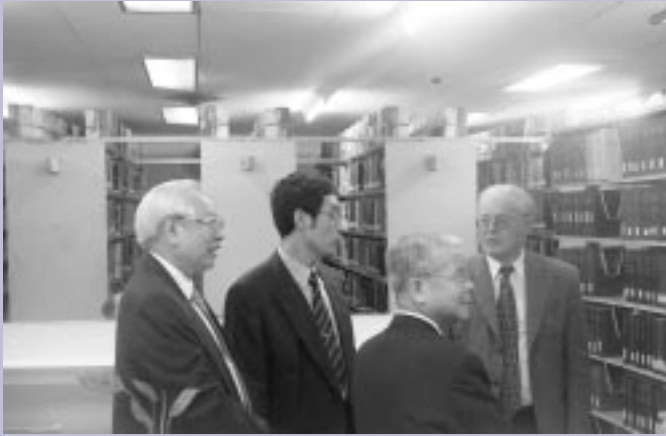
■評鑑委員參訪研圖。