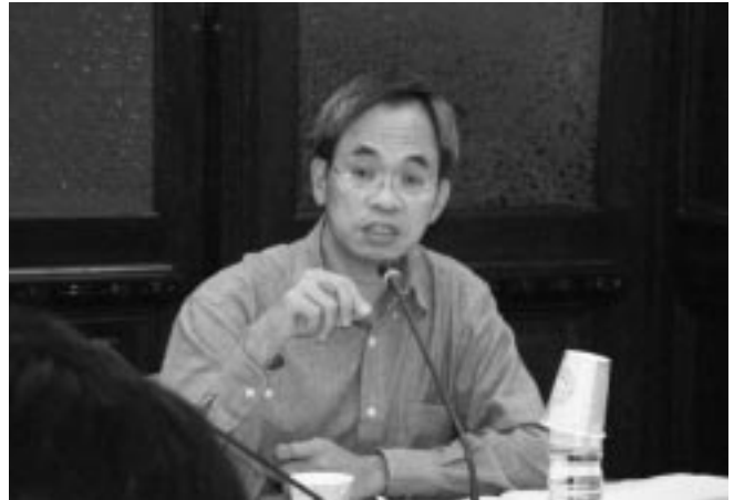
■ 刑事法裁判會第九場報告人黃榮堅教授

門負責本院刑事法相關學術活動之籌備與規劃，除固定舉辦之小型刑事法裁判研討會外，不定期與國內外各學術、實務或研究單位共同舉辦各類大型研討會，並邀請國內外知名刑事法學者蒞臨本院演說；重新調整大學部刑事法課程，以期能更有效提升學習效果；舉辦刑事法學組師生間交流活動，促進師生互動關係與情誼。除此之外，隨時因應本院刑事法教師之需要，盡可能提供一切之協助。