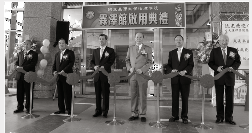
霖澤館剪綵儀式，左起為本院蔡明誠院長、蔡萬才總裁、蔡宏圖董事長、本校李嗣涔校長、陳維昭前校長、司法院翁岳生前院長。