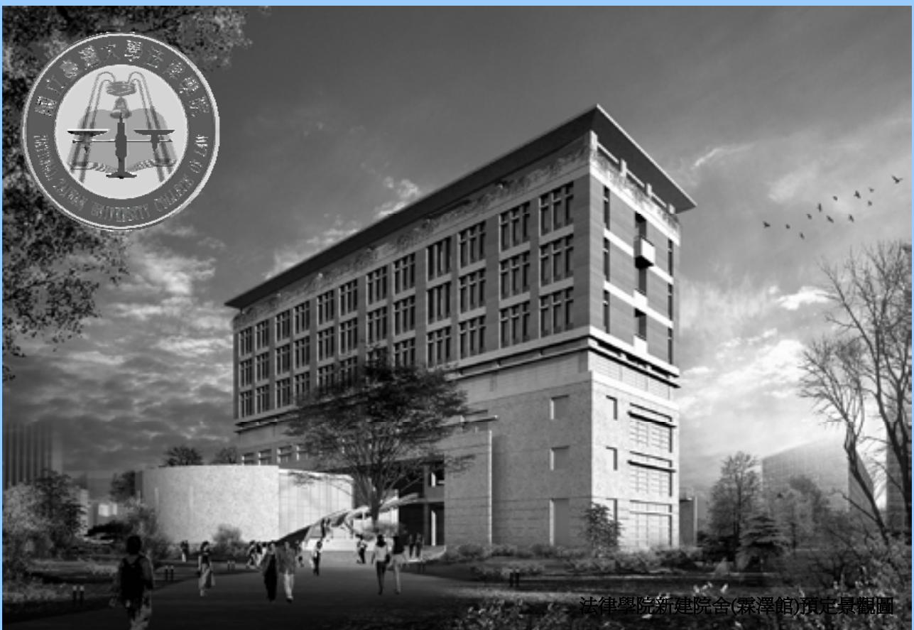
法律學院新建院舍(霖澤館)預定景觀圖