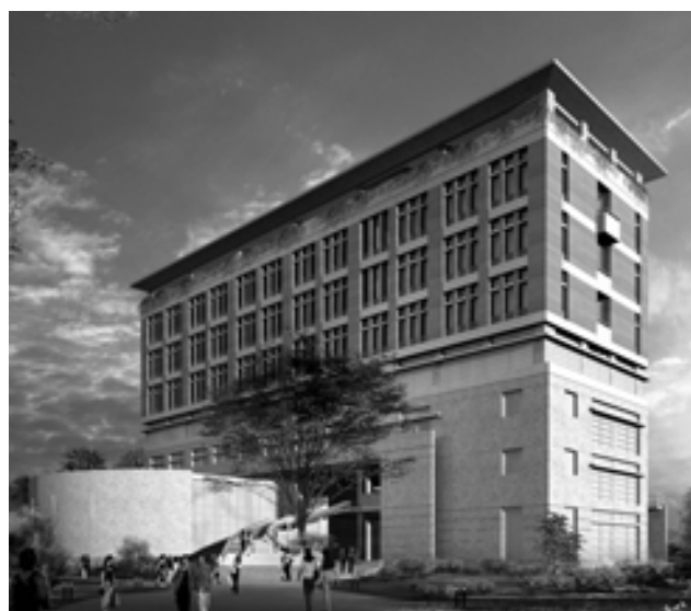
■下右為霖澤館預定景觀圖、下左為萬才館預訂景觀圖

以上兩棟新館預定於明（九十五）年五月開工，工期預估一年十個月，預定於九十七年三月完工。