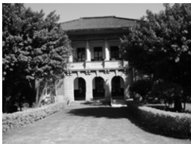
■ 上二圖為法律學院現在景觀，希望將在新院舍中再現